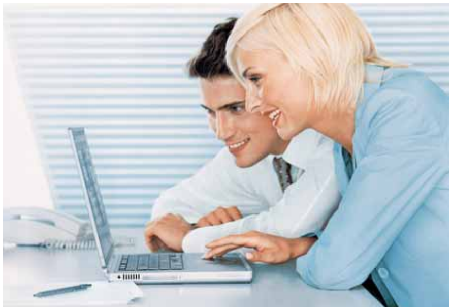
Was ist das „richtige“ Licht? Eine ausgeglichene adaptive Beleuchtung, entsprechend unseren Bedürfnissen. OSRAM bietet zur Erfüllung dieser Beleuchtungsaufgabe Lichtquellen von warmweiß über tageslichtweiß bis zu SKYWHITE®.